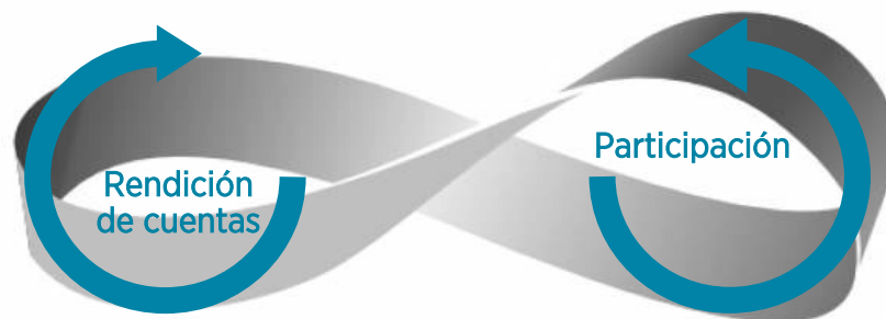
Participación y rendición de cuentas, partes de un mismo proceso